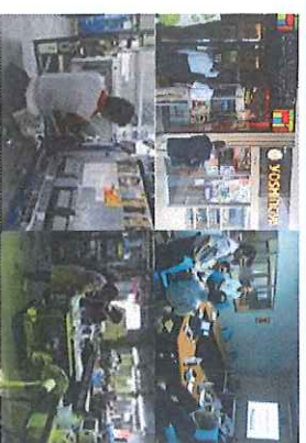
左上：タイ外食企業の現地調査風景 右上：タイ現地企業との打合せ 左下：自動販売機整備作業 右下：券売機組立作業